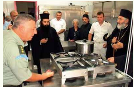
Έπιμέλεια, Φωτογραφίες, Βίντεο: Γεώργιος Ι. Χρυσούλης, Γραμματέας Ίεράς Μητροπόλεως